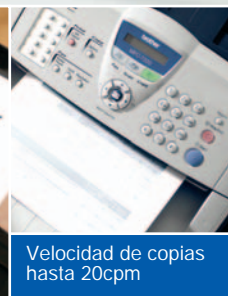
Velocidad de copias hasta 20cpm