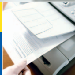
Imprime a 20ppm

Impresora Láser • Fax Láser • Copiadora Láser • Escaner Monocromático • PC Fax