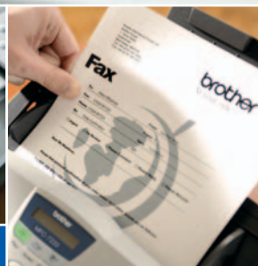
ADF de hasta 20 hojas